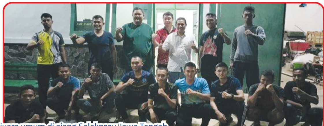
Para pengurus Yayasan NuS dan NUS Business School Alumni Jakarta Chapter dan undangan berfoto bersama.