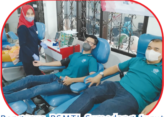
Pengurus PSMTI Sumedang turut mendonorkan darah.