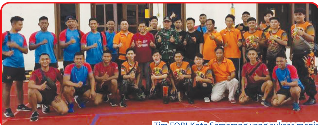
Tim FOBI Kota Semarang yang sukses menjadi juara umum di ajang Selektivitas Jawa Tengah.