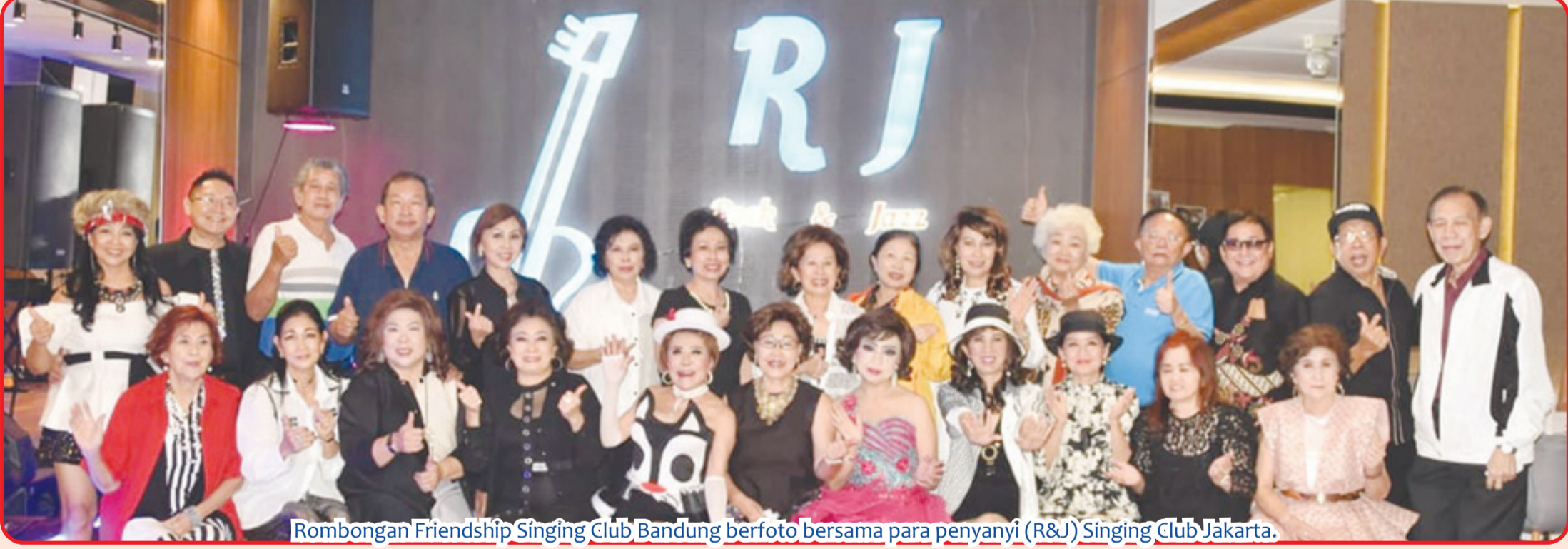
Rombongan Friendship Singing Club Bandung berfoto bersama para penyanyi (R&J) Singing Club Jakarta.

BANDUNG (IM) - Friendship Singing Club Bandung, Minggu (11/9) lalu diundang untuk mengunjungi Rock & Jazz (R&J) Singing Club Jakarta.